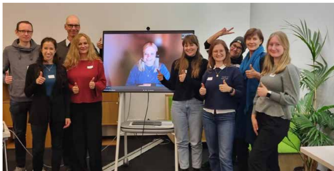
Ein wichtiger Teil des On-Boardings sind jedes Mal die Info-Tage im Haus zum Kennenlernen der Teams, der Kolleg:innen, des Großen und Ganzen und vieler Besonderheiten. Dabei kommt auch der Austausch untereinander keinesfalls zu kurz.