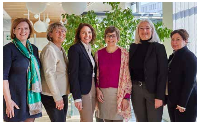
Enge Weggefährten von Anfang an: Die Stiftung Stifter für Stifter (Bilder oben) und die Stiftungszentrum.law Rechtsanwaltsgesellschaft mbH (Bilder links).