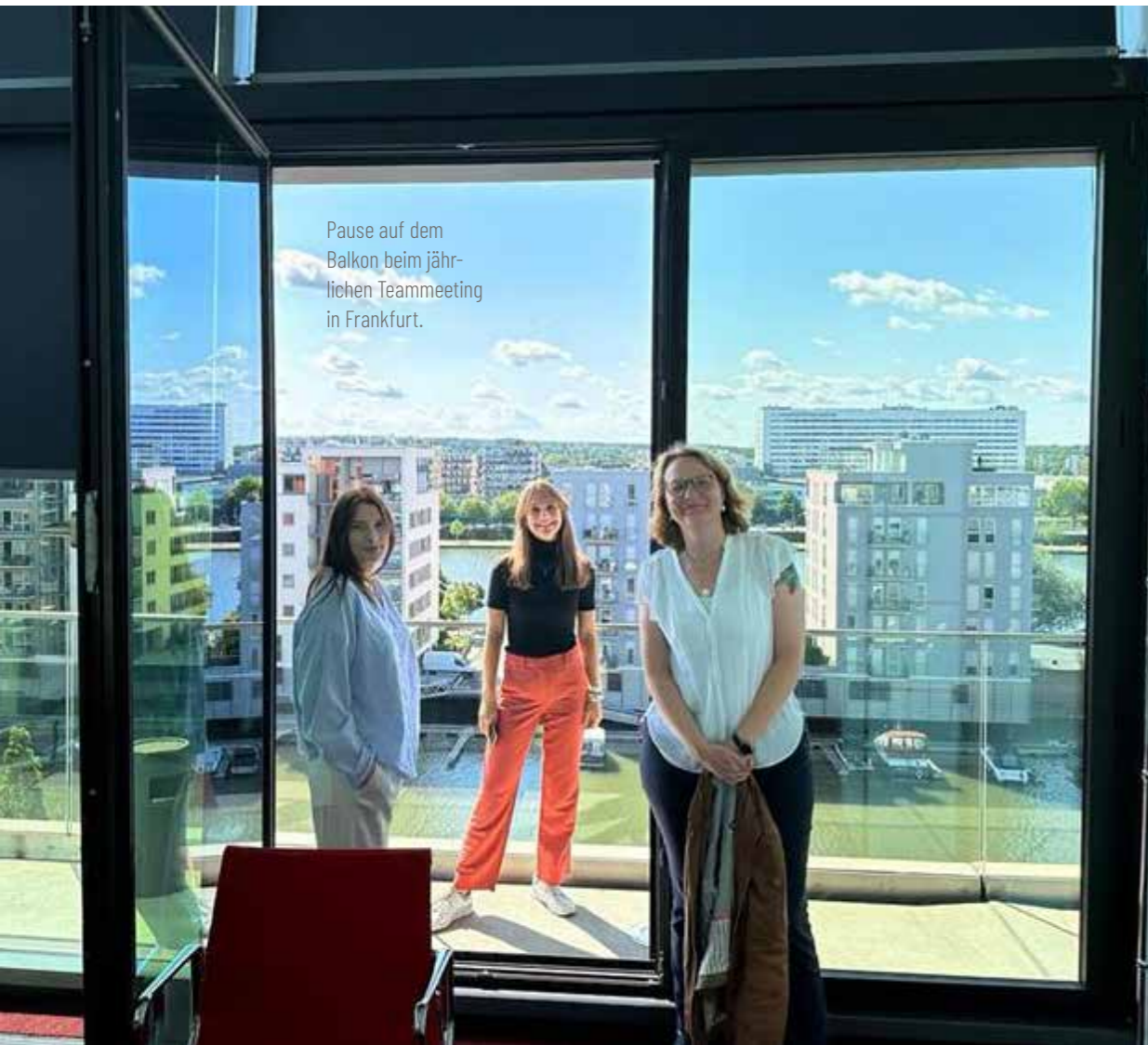
Pause auf dem Balkon beim jährlichen Teammeeting in Frankfurt.