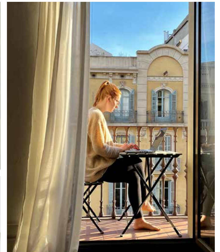
Ob im Homeoffice oder sogar im europäischen Ausland: Man muss nicht immer im Büro arbeiten.